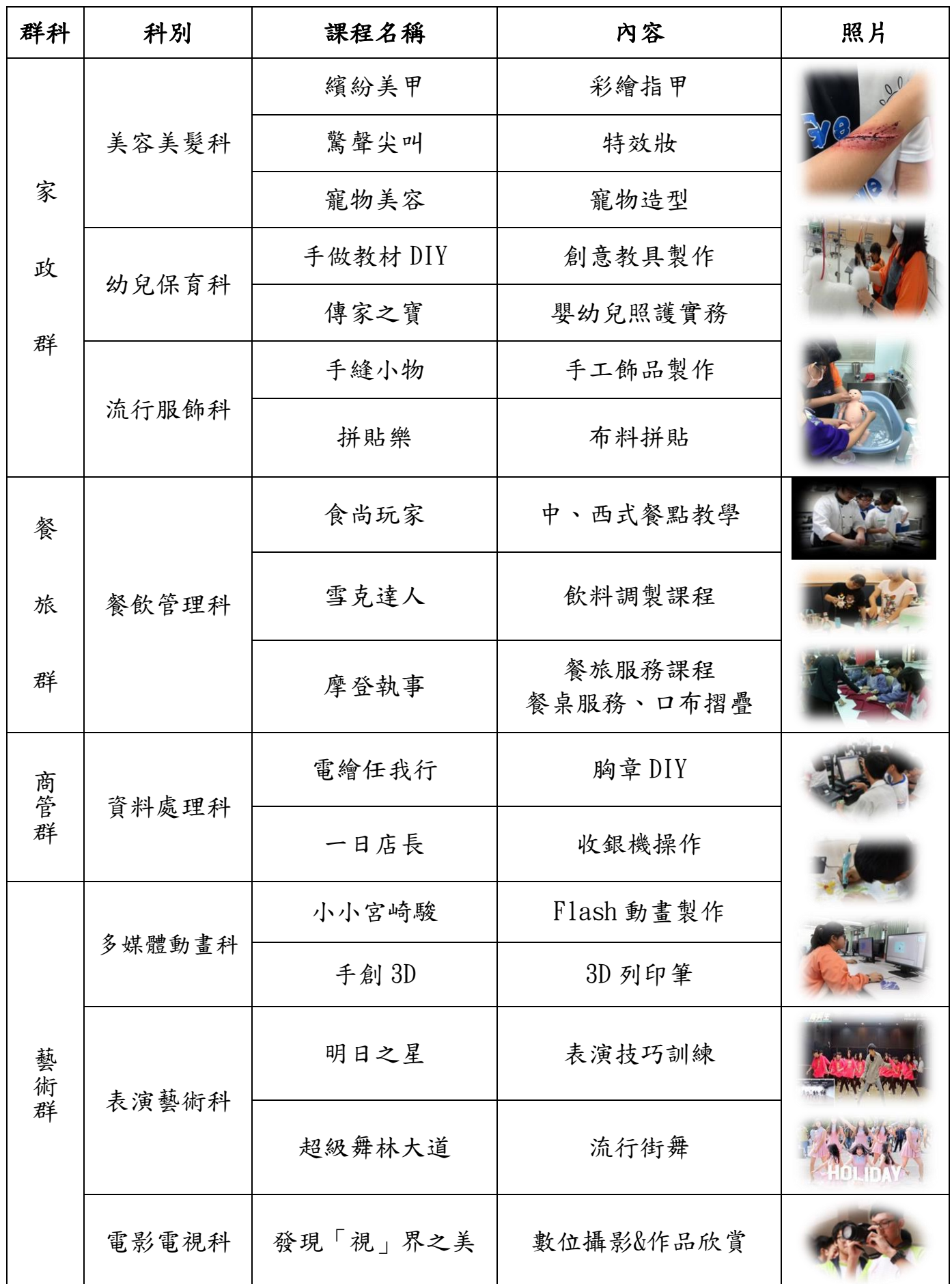
新北市莊敬高職 112 學年度九年級學生職校參訪體驗課程一覽表